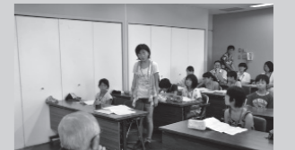
白川町の生徒による研修報告

また、12日には同県高山市から高山少年少女合唱団が来島し、みやこ少年少女合唱団と合同練習、13日はマティダ市民劇場で交歓演奏会、14日には市平良庁舎でロビーコンサートを行い、互いの交流を深めました。