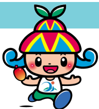
宮古島市イメージキャラクター 「みーや」